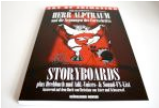
Herr Alptraum und die Segnungen des Fortschritts.