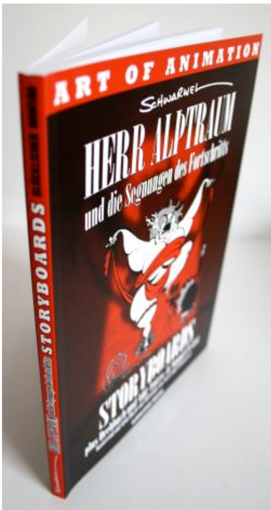
Schwarwel: Herr Alptraum und die Segnungen

In der ersten Buchhälfte gibt es drei ergiebige Vor-Worte, eines besagte Bemerkungen des Künstlers zum eigenen Arbeitsprozess, in denen er auch seinen Weg zum Film und zum Storyboard-Zeichnen schildert. Das ist der eigentliche Teil, aus dem mögliche Lernwillige Ansätze finden mit praktischen Tipps, wie man so ein Storyboard für einen Film anlegen kann, was alles dazu gehört und was damit passiert - vor dem Filmprojekt und währenddessen.